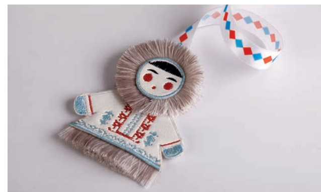
Ляссе с сувенирным элементом