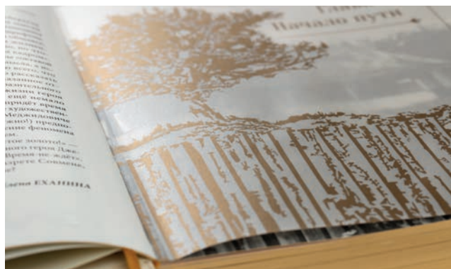
Вставка листа кальки