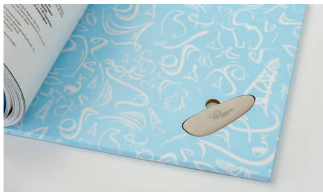
Встроенная флеш-карта в обложке