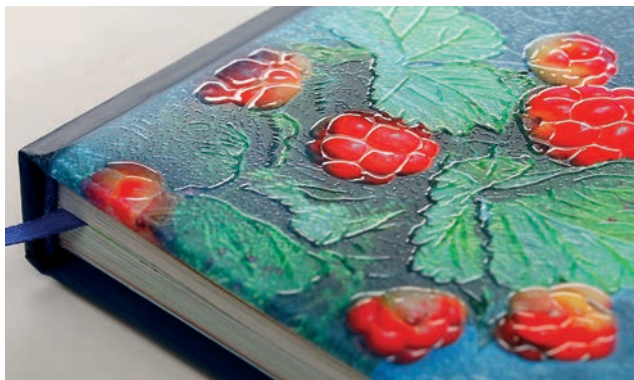
Глянцевый объемный и абразивный УФ-лак