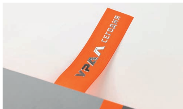
Ляссе с объемным тиснением