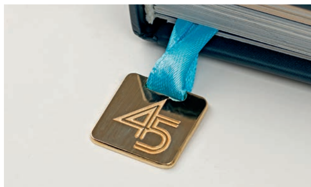
Ляссе с металлическим шильдом