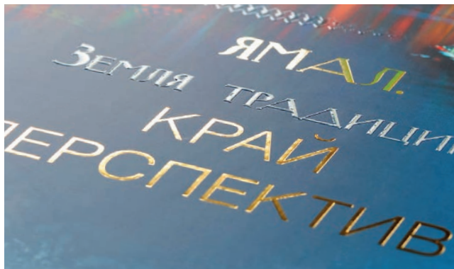
Тиснение золотой глянцевой фольгой