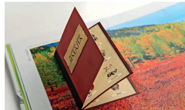
Интерактивный элемент в блоке книги