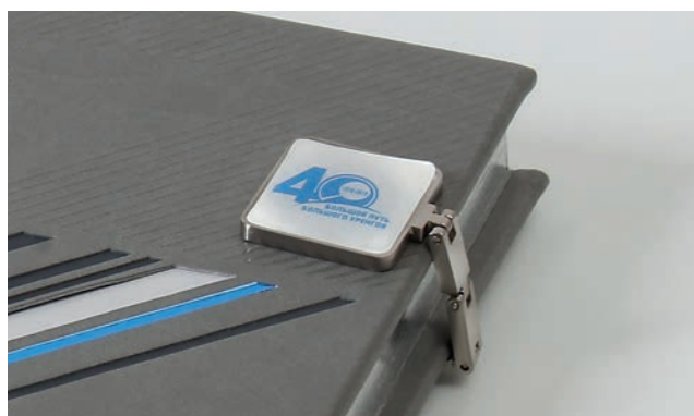
Магнитный хлястик со смоляным шильдом