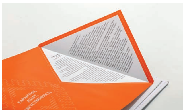
Распашной лист в книжном блоке